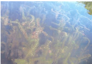
Myriophylle à épi