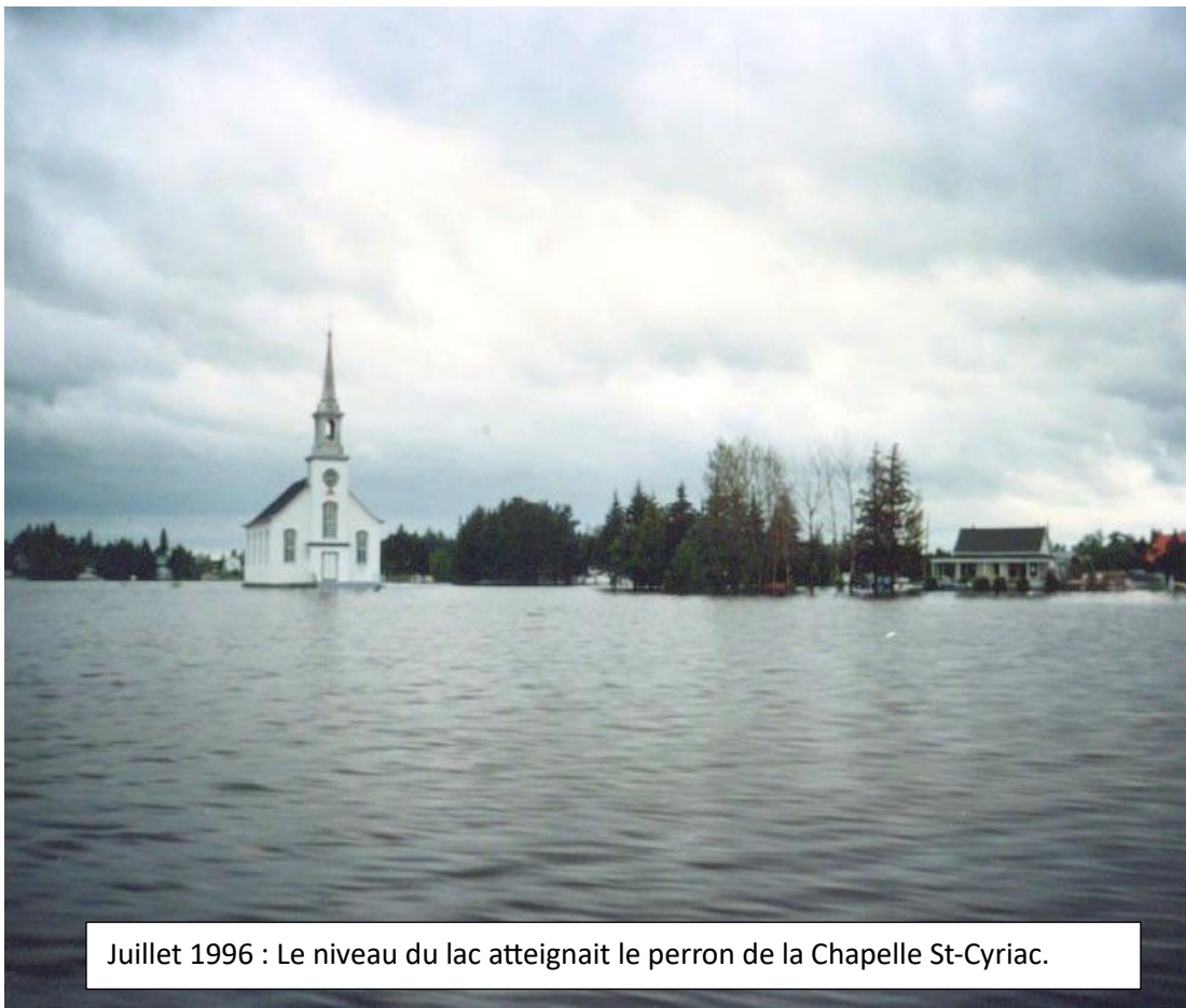
Juillet 1996 : Le niveau du lac atteignait le perron de la Chapelle St-Cyriac.

L'évaluation de l'ampleur de la crue de juillet 1996 permettait de constater que les débits de pointe sortant du lac Kénogami ont atteint 1 856 m 3 /s selon les reconstitutions faites par le ministère de l'Environnement. Sans la présence du lac Kénogami, ces débits de pointe auraient pu atteindre 2 780 m 3 /s dans les exutoires du lac puisqu'il a alors agi comme réservoir d'emmagasinement en retenant 130 hm 3 d'eau (un seul hectomètre 3 représente 1 000 000 m 3 ).